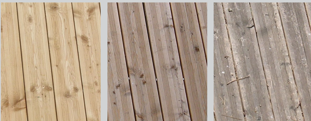
Le vieillissement naturel du bois

La présentation de la technologie Wolman® System ProColor Silvergrey sur la base de petits échantillons ne permet pas d'apprécier pleinement le rendu final d'un ouvrage.